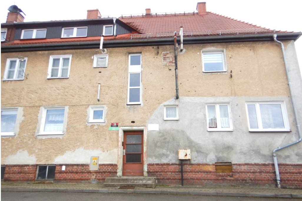
Ogólny widok budynku

na sprzedaż lokalu mieszkalnego Nr 2 znajdującego się w budynku położonym w Lubaniu przy ul. Parkowej 19 wraz z udziałem we współwłasności nieruchomości gruntowej (działka nr 93, AM 3, Obręb V o powierzchni 149 m 2 , JG1L/00015993/5)